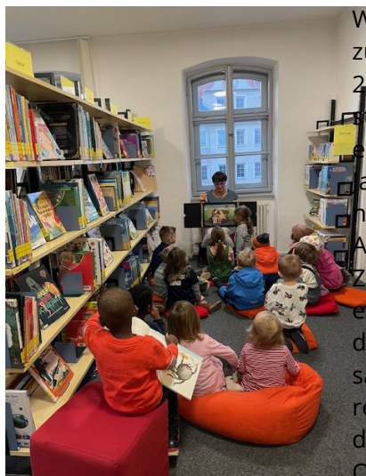
Vorlesen in der Bücherei

Mit 4,86 liegt er für die Bücherei Velden weit über dem bayrischen Durchschnitt. Insgesamt verbuchte die Bücherei in Velden für 2024 36.018 Ausleihen. Zum Vergleich: 2023 wurden „nur“ 34.663 Ausleihen verbucht. Ergänzt wird das Angebot noch durch die Einbindung der Bücherei Velden in LeoSüd, einer Online-Bücherei. Auch diese wurde 2024 gerne genutzt und verbuchte 3.402 Ausleihen. Doch nicht nur die Medien machen eine Bücherei aus. Sie lebt vor allem durch ihre Nutzer. 656 aktive Leser aller Altersstufen zählt die Gemeindebücherei Velden. Diese besuchten sie 2024 mehr als 10.000-mal und ermöglichten durch ihr Interesse und ihre Begeisterung am Lesen das positive Ergebnis.